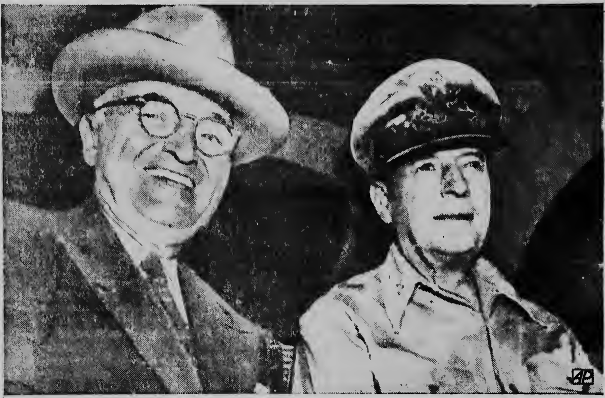
Hierboven: GENERAAL MACARTHUR met OUD-PRESIDENT TRUMAN, die het niet eens was met de standpunten van de generaal over de Koreaanse oorlogvoering en een abrupt einde maakte aan zijn militaire carrière. Ter gelegenheid van zijn 75ste verjaardag heeft generaal Douglas MacArthur belangwekkende woorden gewijd aan de toestand in het Verre Oosten, die deze dagen zo kritiek is.